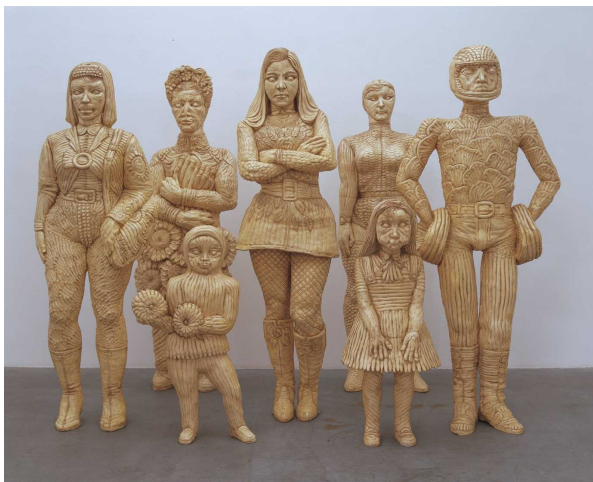
西尾康之《素粒の鎧》1997 photo by 木奥恵三 Courtesy of YAMAMOTO GENDAI 高橋コレクション蔵