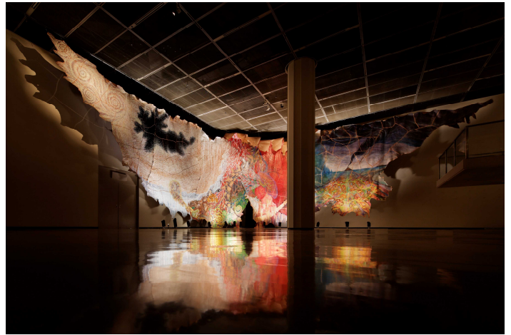
鴻池朋子《皮綴帳》2015 ©Tomoko Konoike 高橋コレクション蔵