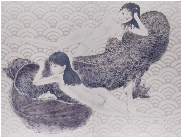
会田誠《大山椒魚》2003 ©AIDA Makoto photo by 木奥恵三 Courtesy of Mizuma Art Gallery 高橋コレクション蔵