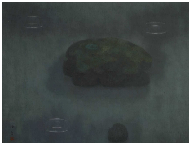
徳岡神泉《雨》1964(昭和39年)