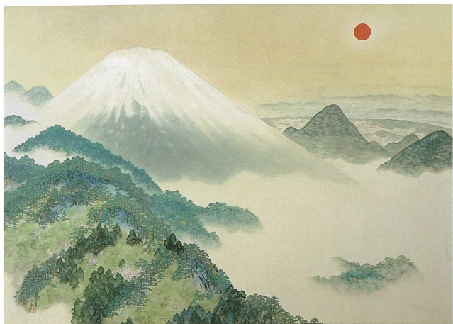
横山大観《日出処日本》1940(昭和15年)