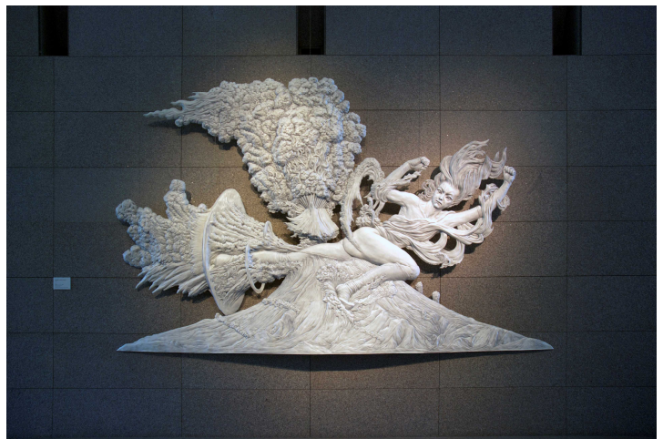
西尾康之《FUJI》2013 (部分) Courtesy of YAMAMOTO GENDAI 高橋コレクション蔵