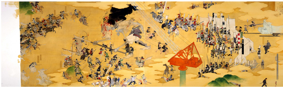
山口晃《當世おぼか合戦》1999 YAMAGUCHI Akira 高橋コレクション蔵