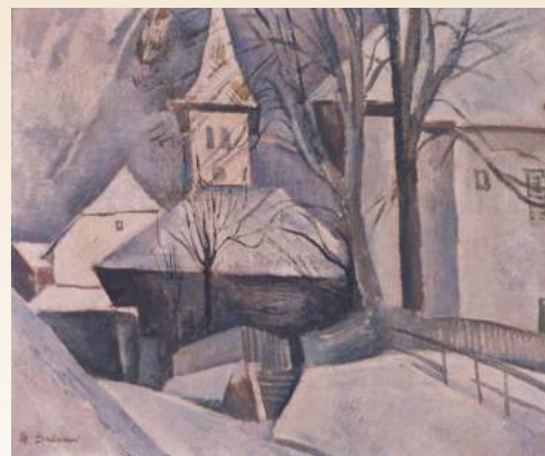
佐分真「雪のグリュンデルワルト」昭和2年(1927)キャンヴァス、油彩