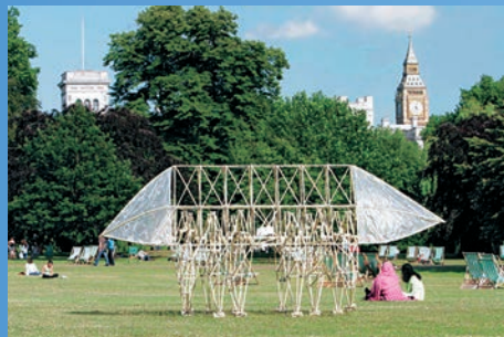
《アニマリス・オルティス》2006