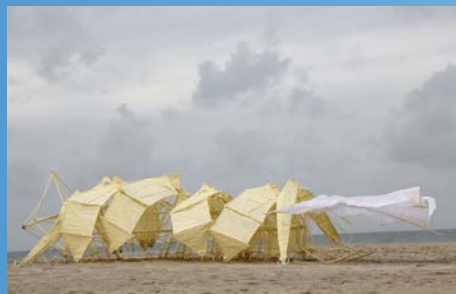
《アニマリス・ミミクラエ》2019