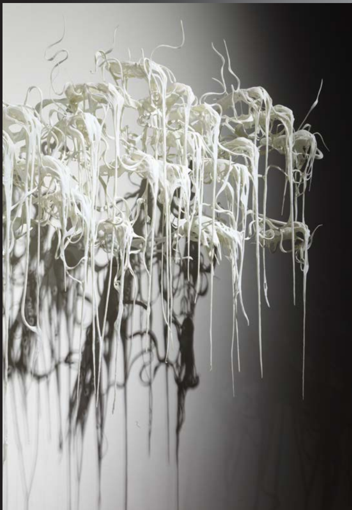
小谷元彦(Hollow:Pianist/Rondo) (部分) 2009年