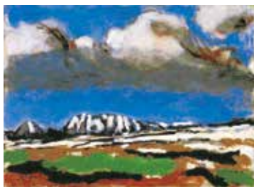
曾宮一念《毛無連峯》 SOMIYA Ichinen The Kenashi Mountain Range