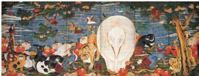
伊藤若冲《樹花鳥獣図屏風》(右隻) ITO Jakuchu Birds and Animals in the Flower Garden

Please enjoy our wide-range collection. It includes landscapes of both Japan and Western countries, sculptures of Rodin and generations afterwards, and Mt.Fuji paintings.