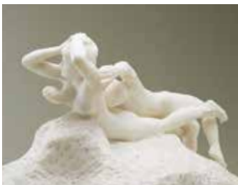
オーギュスト・ロダン《フギット・アモール》 Auguste RODIN Fugitive Love [ Fugit Amor ]