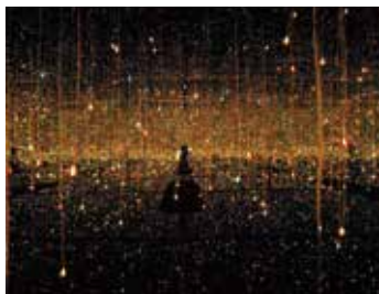
草間彌生《水上の螢》 KUSAMA Yayoi Fireflies on the Water