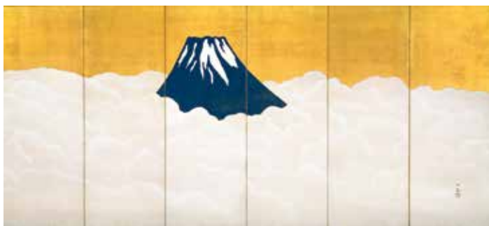
横山大観《群青富士》(右隻) YOKOYAMA Taikan Mt. Fuji Dyed Ultramarine