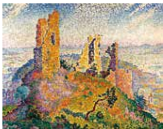
ポール・シニャック《サン＝トロペ、グリモーの古城》 Paul SIGNAC The Ruins at Grimaud, Saint-Tropez