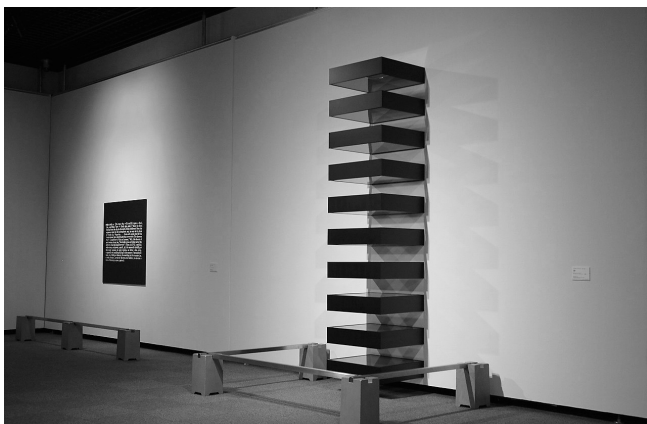
▲ Part.1 展示風景

Part.1では、草間彌生《無題》、ドナルド・ジャッド《無題》、アンゼラム・キーファー《極光》など、開館以来、美術の現況をしめすコレクションの形成に努めてきた当館の現代コレクションを代表する作品の紹介を行った。Part.2では所蔵家A氏のコレクションの中から宮島達男、イ・ブル、小谷元彦など近年活躍が目覚しい作家で、当館で作品を収蔵していない作家を中心に構成した。なお、河原温の絵画については、所蔵家から借用した2点に加えて、当館が収蔵する3点を組み合わせて展示した。Part.3では、所蔵家B氏のコレクションの三本柱となる、(1) 李禹煥、山口長男の油彩画、(2) 現代の焼き物、(3) 写真コレクションの中から、収集家の個性が現れる作品を選定した。特に李禹煥の絵画については、B氏のコレクションの中でもとりわけ充実を誇る、1980年代後半の《風と共に》から《照応》シリーズへの移行期の作品を中心に選定し、以前より、同所蔵家から寄託を受けている《風と共に》3点を併せて展示した。