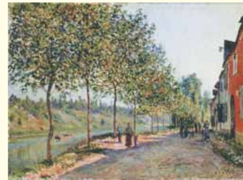
アルフレッド・シスレー (サン＝マメス六月の朝) 石橋財団ブリヂストン美術館 Bridgestone Museum of Art, Ishibashi Foundation, Tokyo