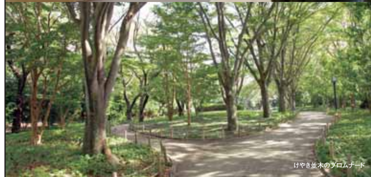
けやき並木のプロムナード