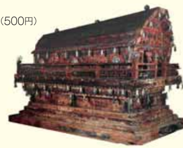
彩色木棺 トルキスタン古墳出土

中国の草原地帯で勢力を誇った契丹・遼王朝。遊牧民族が育んだ崇高かつ美麗な文化を一挙公開。