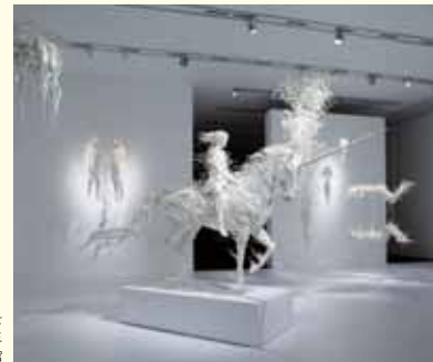
森美術館での展示風景

移動美術展 静岡県立美術館の収蔵品を中心に移動美術展を実施いたします。 ◎第1会場 9/10[土]~25[日] モン・ミュゼ沼津(沼津市庄司美術館) ◎第2会場 調整中