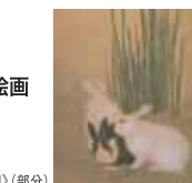
円山応挙(木賊免図)(部分)