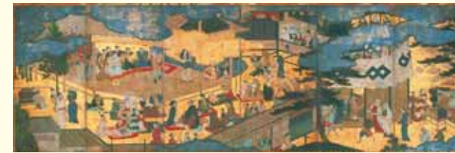
〈阿国歌舞伎廻屏風〉京都国立博物館蔵 重要文化財

国宝6件、重要文化財22件を含む日本・東洋美術の精華。至高のコレクションでたどる風景へのまなざしと“聖なるもの”への思い。