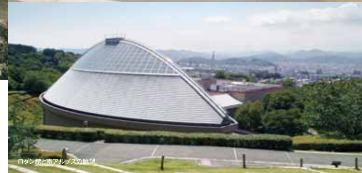
ロダン館と街アルプスの眺望

ガラス屋根からふりそそぐ 明るい光の中に 奇跡とも呼べるような 光景が広がります。 世界でも屈指の ロダン・コレクション32点が ここ静岡県立美術館のロダン館で ご覧頂けます。