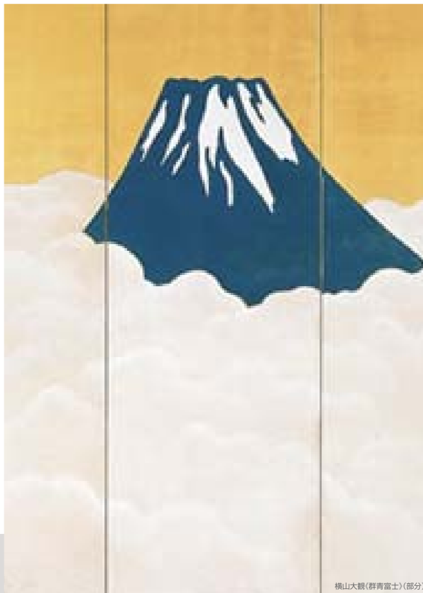
横山大観(群青富士)(部分)

風景とロダンの 静岡県立美術館 Shizuoka Prefectural Museum of Art