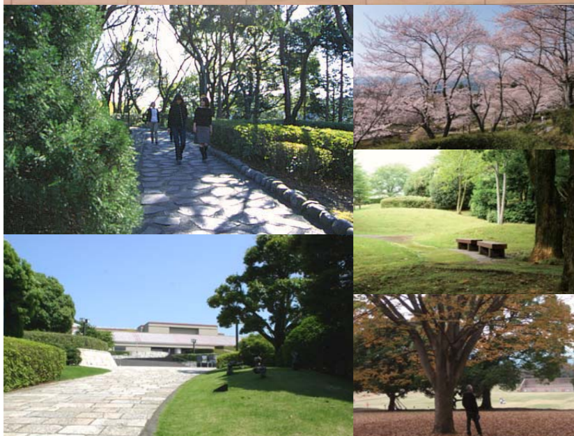
ロダン館と南アルプスの眺望