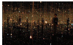
草間彌生《水上の螢》当館蔵