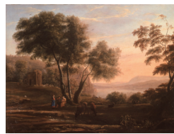
クロード・ロラン《笛を吹く人物のいる牧歌的風景》当館蔵