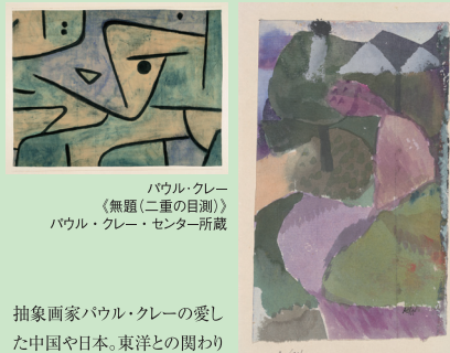
抽象画家パウル・クレーの愛した中国や日本。東洋との関わりから生まれた作品を中心に、知られざるクレーの生涯と芸術を再発見する展覧会。

一般 1,100円(900円) 高校生・大学生・70才以上 500円(400円) 中学生以下は無料