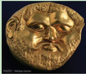
21世紀の大発見と言われる「トラキア王の黄金のマスク」を、日本初公開。紀元前5000年紀の黄金文明への扉が、今開かれる!

一般 1,200円(1,000円) 高校生・大学生・70才以上 600円(500円) 中学生以下は無料