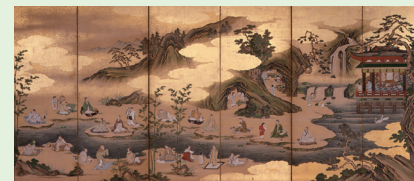
狩野永納《蘭亭曲水図屏風》(右隻)当館蔵

一般 600円(400円) 高校生・大学生・70才以上 300円(200円) 中学生以下は無料