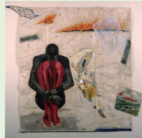
静岡県出身で世界的に活躍中の美術家・柳澤紀子の全貌を紹介。代表作「水邊の庭」シリーズのほか版画作品約80点。ミクストメディア作品によるロダン彫刻とのコラボレーションも予定。

一般 800円(600円) 高校生・大学生・70才以上 400円(300円) 中学生以下は無料