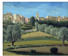
長谷川潔《南仏風景》当館蔵